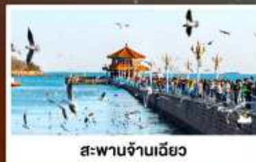
สะพานจั๊นเฉียว