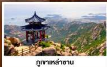
ภูเขาเหลาชาน