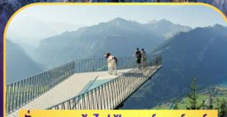
นั่งรถกระเช้าไฟฟ้า ชาร์เตอร์ คูลัม