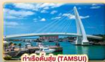
ท่าเรือคันทันซุย (TAMSUI)