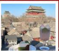
คาเฟ่ฟ้าตาล