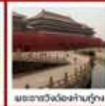
พระราชวังฤดูร้อนด้านหน้า