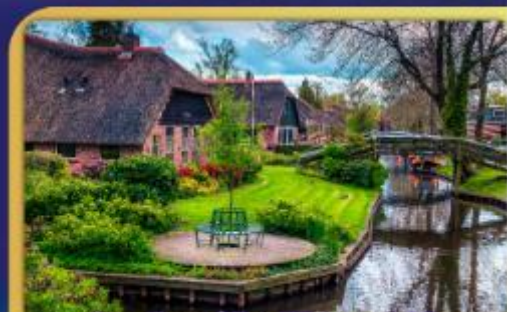
ล่องเรือหมู่บ้านไรทอนท์ธูร์น