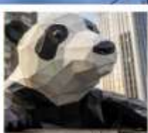
ห้าง IFS หมีแพนด้าปิงตึก