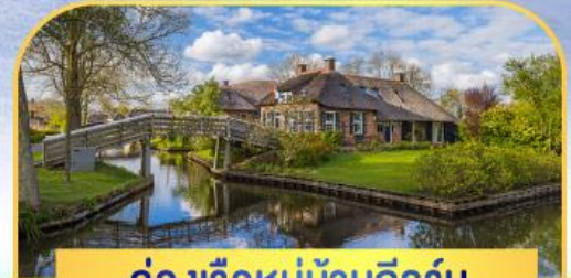
ล่องเรือหมู่บ้านทีรูรัน