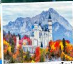
ปราสาทน้อยชวานสไตน์