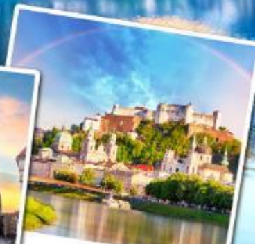
ชาลส์บวร์ก

เที่ยวหมู่บ้านฮิลสติกที่สวยงามที่สุดในโลก เข้าชมความงดงามภายในของปราสาทน้อยชวานสไตน์