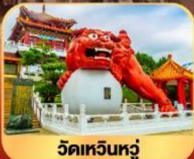
วัดเหวินหนู่