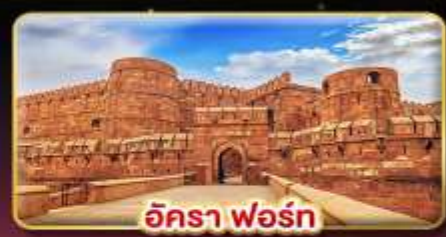
อัครา ฟอรั