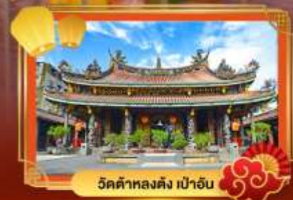
วัดต้าหลงตั้ง เป่าอัน